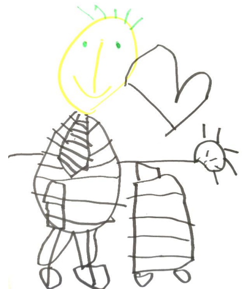
Amélie du Toit 4 jaar oud